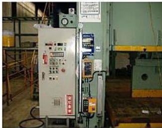
10000KNストレートサイド形プレス領域指定透過式安全対策措置+透過式安全装置取付例