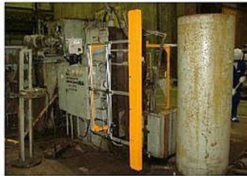
1000KN真円度矯正機用透過式安全装置設計製作取付例